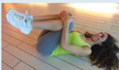
Alcuni esempi di esercizi utili al benessere delle articolazioni inferiori.

(sciatalgia). È dovuta alla compressione o all'infiammazione del nervo sciatico, generalmente conseguente ad una discopatia, ad una gravidanza, a posture sbagliate, al lavoro errato dei muscoli del gluteo e della schiena, ad un'ernia al disco.