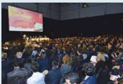
Alcuni momenti del Congresso tenutosi a Roma dal 18 al 20 aprile.

Evidenza Scientifica, Interdisciplinarietà e Tecnologie Applicate: queste sono state le 3 key words su cui si è sviluppato il XX Congresso del Collegio dei Docenti di Odontoiatria a Roma