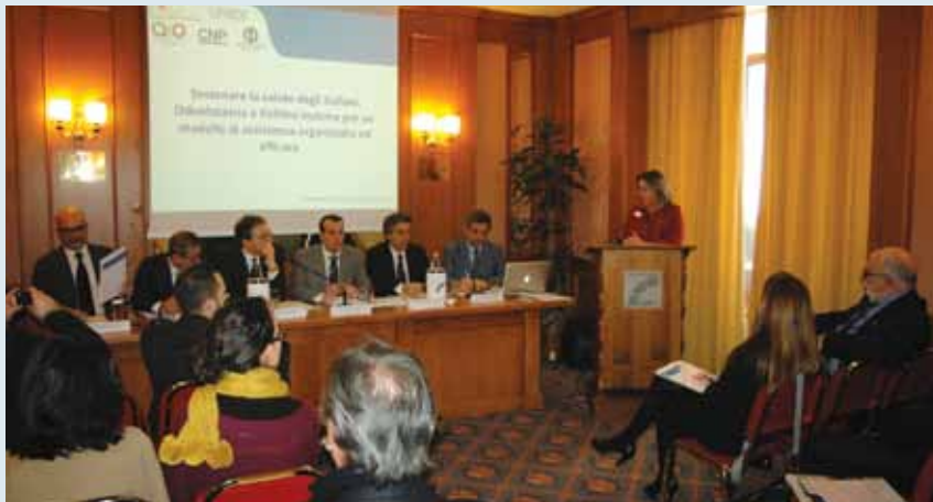
L'intervento tenuto dal neo Ministro Beatrice Lorenzin all'incontro promosso dal Tavolo del dentale lo scorso febbraio a Roma.