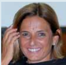
prof.ssa Antonella Polimeni Presidente Collegio dei Docenti di Odontoiatria