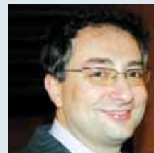
dr. Gianfranco Prada Presidente ANDI

Il vigente Codice di Deontologia medica, all'art. 4 comma 2, testualmente prevede: "il Medico nell'esercizio della professione deve attenersi alle conoscenze scientifiche e ispirarsi ai valori etici della professione, assumendo come principio il rispetto della vita, della salute fisica e psichica, della libertà e della dignità della persona; non deve soggiacere ad interessi, imposizioni e suggestioni di qualsiasi natura". È quindi evidente il "primato dell'etica" come elemento di guida e di ispirazione per i Medici e per gli Odontoiatri in ogni ambito in cui la loro attività venga ad esplicarsi. Questi principi trovano ulteriore e maggior valenza per quei professionisti che vengono chiamati a ricoprire incarichi di "formatori" delle nuove leve professionali, cariche istituzionali e/o associative in rappresentanza della professione. Colui, quindi, che liberamente accetta una carica istituzionale è chiamato a svolgere quella che una volta era definita una "funzione onoraria" attraverso comportamenti che siano irreprensibili e che costituiscano la migliore garanzia per tutti i colleghi di essere rappresentati da persone di specchiata moralità.